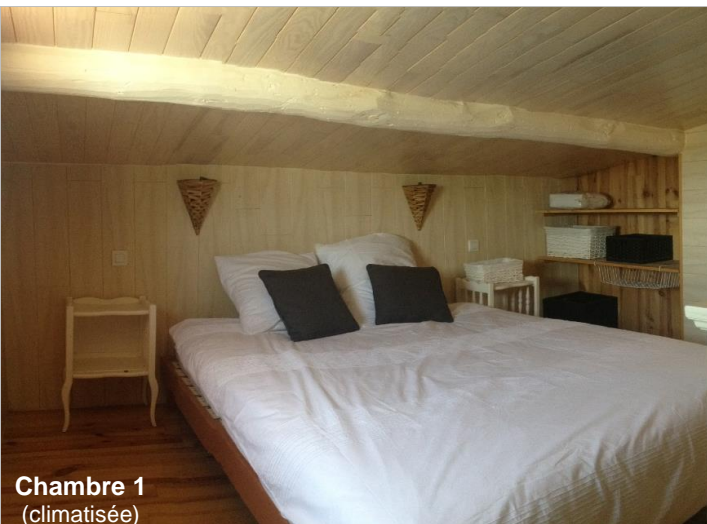
Chambre 1 (climatisée)