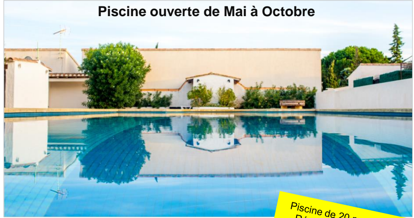
Piscine ouverte de Mai à Octobre

Piscine de 20 m de long Résidence sécurisée Lave-linge Lave-vaisselle Climatisation 3 TVs + DVD