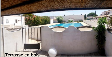
Terrasse en bois

Situé à 1600 m du village des Saintes Maries et 1900 m de la plage