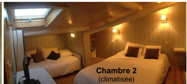
Chambre 2 (climatisée)