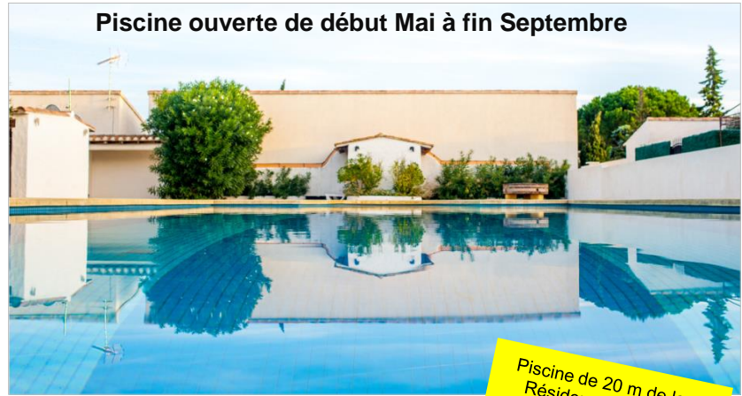
Piscine ouverte de début Mai à fin Septembre

Piscine de 20 m de long Résidence sécurisée Lave-linge Lave-vaisselle Climatisation 3 grandes TVs