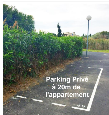
Parking Extérieur juste en face de la résidence (où nous viendrons vous accueillir)