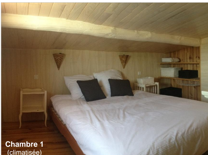
Chambre 1 (climatisée)