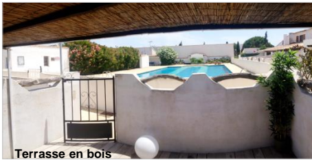
Terrasse en bois

Situé à 1600 m du village des Saintes Maries et 1900 m de la plage