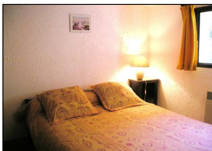
Ch.1 (couchage 2 pers.)

Draps non fournis (possibilité de location sur demande)