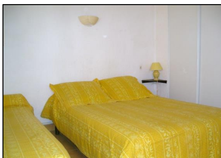
Ch.2 (couchage 3 pers.)