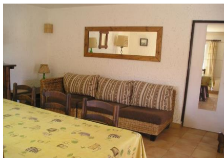
Séjour avec TV