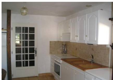
Cuisine (lave vaisselle)