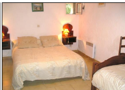
Ch.3 (couchage 3 pers.)